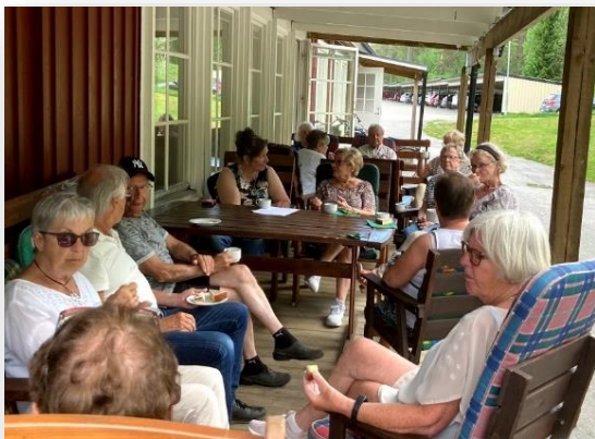
UFS årsmöte i juni var ett kärt återseende efter ett års uppehåll i medlemsträffar.

Den 6 juni hade Umeå Finlandssvenskar årsmöte på Vargvägen. Ett 20-tal medlemmar ställde upp på den enda medlemsträffen sedan senaste årsmöte. Stämningen var god med förhoppningar om att vi nu kanske kan återgå till normal verksamhet igen efter Coronaåret.